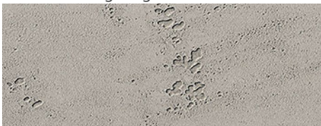
120 imi-beton glatt grau