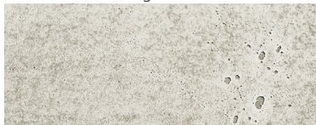
224 imi-beton Vintage standard