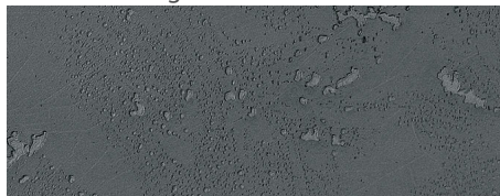
121 imi-beton glatt anthrazit